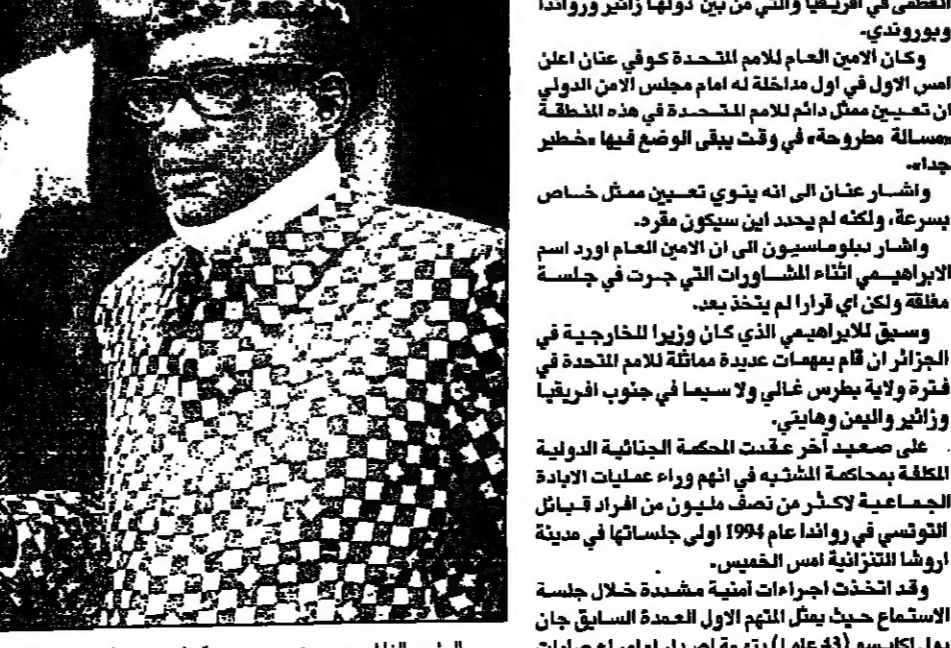
فوك درايسكو فيتش وزير الخارجية الصربي.

برغراد - ا. ب. اعتبر فوك درايسكو فيتش أحد القادة الصربيين في مقابلة صحفية في بيان له اليوم إن درايسكو فيتش يعتبر استقالة ميلوسيفيتش الحل الامثل لوقف النزاع في صربيا. وقال فوك درايسكو فيتش في بيان له اليوم إن درايسكو فيتش يعتبر استقالة ميلوسيفيتش الحل الامثل لوقف النزاع في صربيا.